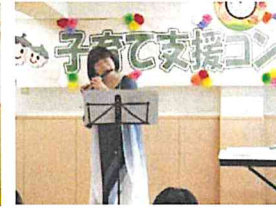
【子育て支援コンサート】